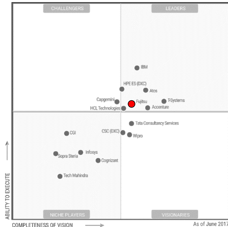
Аутсорсинг ЦОД и сервисы управления инфраструктурой