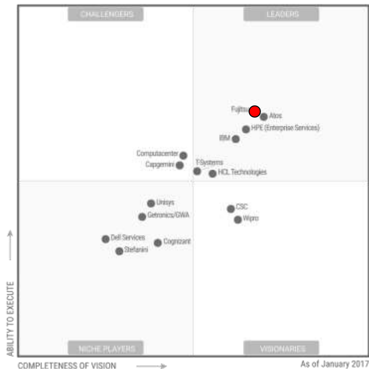
Сервисы управления рабочими местами