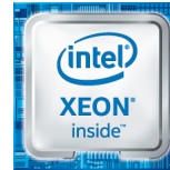
Intel® Xeon® Prozessor