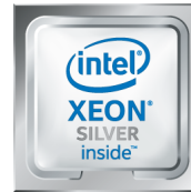
Intel® Xeon® Silber-Prozessor